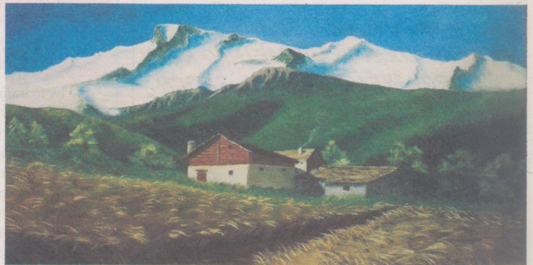
Text a snímky: KKS Čadca

A keďže vajíčka potrebovali podstavce, kúpil som od kamarátky malý sústruh a začal som, ako laik, s tým najťažším, malými drevenými pod-